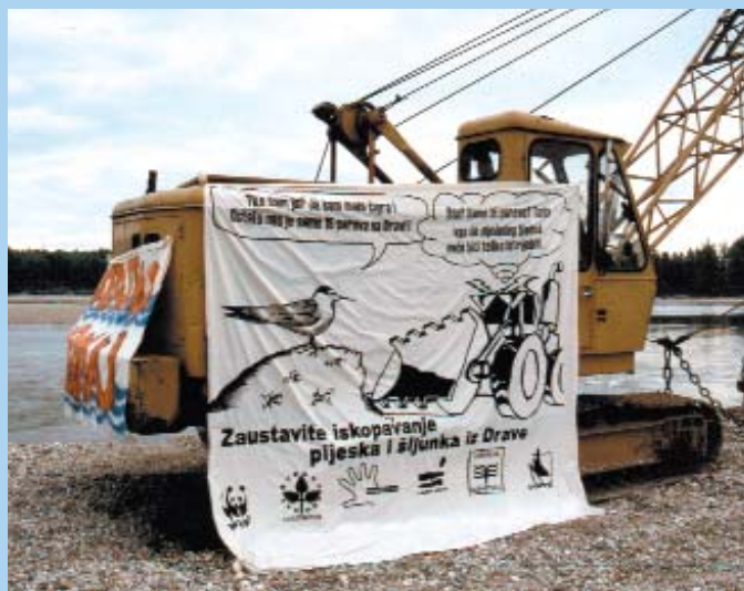
Közös tüntetés a kavicsbányászat ellen. Parton üzemelő markolók és úszó kavicskotrók egyaránt dolgoznak a Dráván.

Kiadja: WWF Magyarország 1124 Budapest, Németszőlgyi út 78/B Tel.: (1) 214-5554, Fax: (1) 212-9353 www.wwf.hu ; panda@wwf.hu Számlaszám: Raiffeisen Bank 12001008-00222222-00200006 Adószám: 18226814-2-43