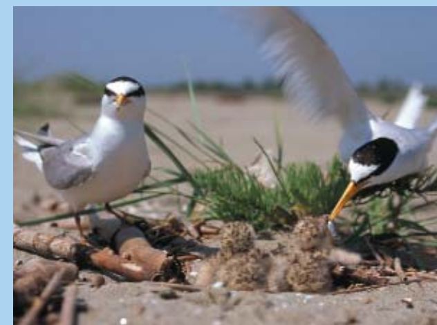
A kis csér hazánkban csak a Dráva kavicszátonyain fészkel.

rása megváltozott, és ezért medermélyülés kezdődött, amely az elmúlt száz évben közel egy méteres volt. A kavicsbányászat és a síkvidéki vízerőművek működtetése következtében a medermélyülés napjainkban is zajlik. A Dráva-menti síkságon ma sok helyen öntözésre van szükség, a legelők egyre kevésbé termékenyek, a meglévő ligeterdőket a kiszáradás fenyegeti. A táj korábbi erdős-legelős jellege átalakult, a holtágak és mellékágak esetében vízpótlásra van szükség. A mederfenntartás ma is beavatkozásokkal jár, és további veszéllyel fenyeget a folyóra tervezett újabb vízerőmű Novo Virjénél.