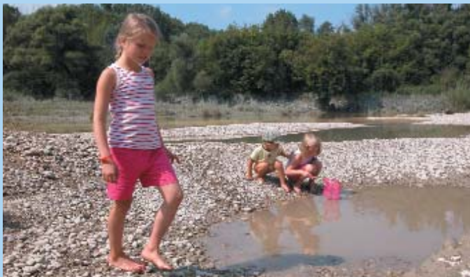
A Dráva mentén élők manapság ritkán látogatnak ki a folyópartra.

Gyors folyású, egyik legtisztább vizű folyónk legértékesebb szakaszain védett fajok találják meg életfeltételeiket, köztük vannak olyanok is, melyek hazánkban csak itt élnek. A madár- és halfajok egyedszáma az utóbbi időben jelentős mértékben csökkent, mivel