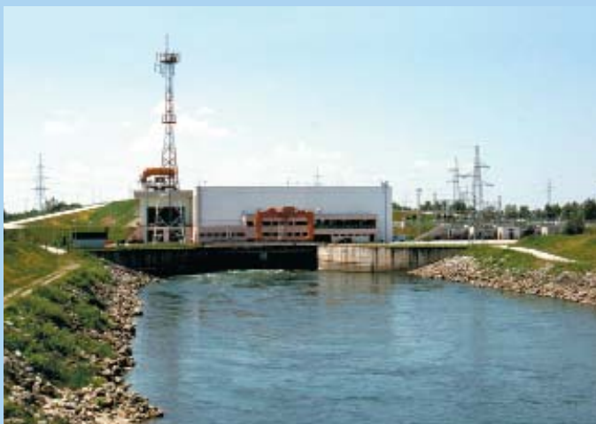
A Dubravai erőmű az egyik legnagyobb vízerőmű a Dráván. A csúcsrajaratott üzemmód rendszeres, közel egy méteres vízszintingadozást okoz.

A táj legnagyobb része ártéri síkság, ahol a folyót kísérő galériaerdőket, holtágakat és különböző ártéri szinteket találhatunk. A Dráva-mente mai képét jelentősen befolyásolja az emberi tevékenység: az erdőirtások, az 1700-as években kezdődött szabályozási munkák és a kavicsbányászat. A folyószabályozás eredményeként a folyó vízjá-