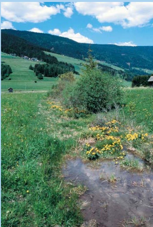
A Dráva az Alpokban kis hegyi folyóként kezd közel 700 km-es útját.

Mindannyian felelősek vagyunk a folyó megőrzéséért, hogy a jövő nemzedékek is élettel teli természetet találjanak a Dráva mentén! Üzenetünk mindenki számára egyértelmű: